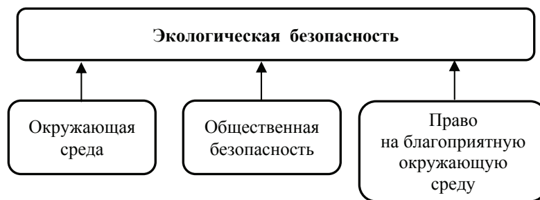
Рис. 1. Три базиса экологической безопасности

Соответствующее понимание складывается в результате анализа дефиниции экологическая безопасность в периферии вопроса о составляющих компонентах объекта уголовно-правовой охраны. Статья 1 Федерального закона «Об охране окружающей среды» от 10.01.2002 № 7-ФЗ определяет экологическую безопасность следующим образом: «Экологическая безопасность – состояние защищенности природной среды и жизненно важных интересов человека от возможного негативного воздействия хозяйственной и иной деятельности, чрезвычайных ситуаций природного и техногенного характера, их последствий» 1 . Безусловно, взаимосвязь с указанной выше составляющей – окружающей средой – легко прослеживается. Об этом говорят такие составные части определения, как «природная среда», а также жизненно важные интересы человека (формирующиеся, в частности, на соответствующих составляющих среды обитания человека). Окружающая среда, выступая в качестве объекта уголовно-правовой охраны, взаимодействуя с другим таким объектом, общественной безопас-